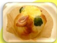
インスタベーカリー