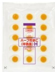
スーマン ハーフたまご(半熟風) H

品番: 52536 内容量: 20g×15個/16トレイ 賞味期間: 冷凍1年 解凍後日持ち目安: 30℃×48時間